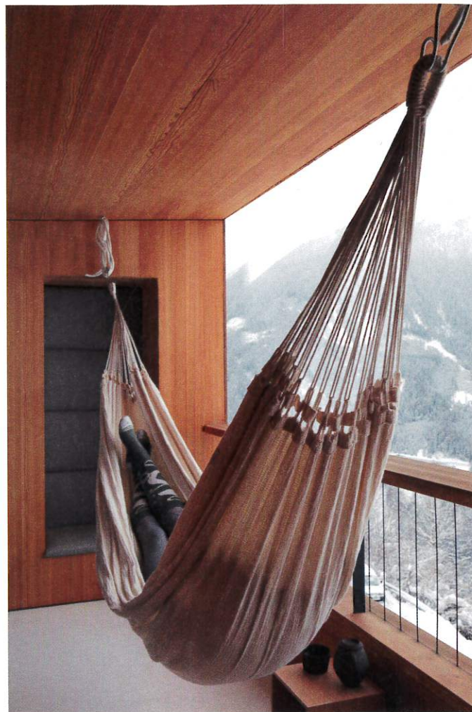
Loggiaen utenfor barnerommene har også en sittebenk kledd med stoff fra Kvadrat. Den brukes til avkjøling etter økter i dampbadet.