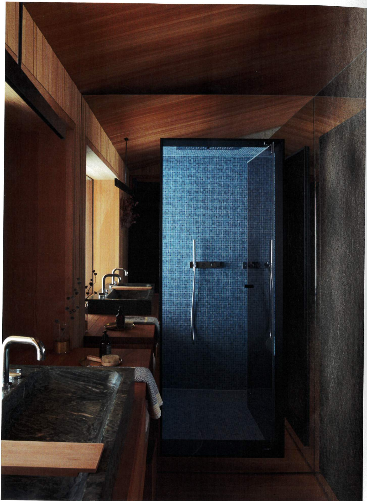
Badet har en dampdusj kledd med italiensk mosaikk av Sicis. I tradisjonen med badstukulturen har badet tilgang til et lite balkongområde med nisjebenk, for nedkjøling etter økter i dampbadet. Vasken er laget av steinen som ble tatt ut på stedet da grunnarbeidene til fundamentene ble gravd. Armatur fra Boffi.