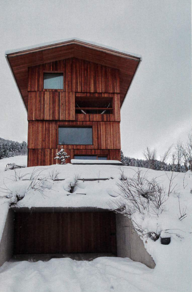
Inngangsnivået til Tårnhuset er inn til garasjen med et fotavtrykk nesten dobbelt så stort som for boarealene som måler 8 m x 8 m.